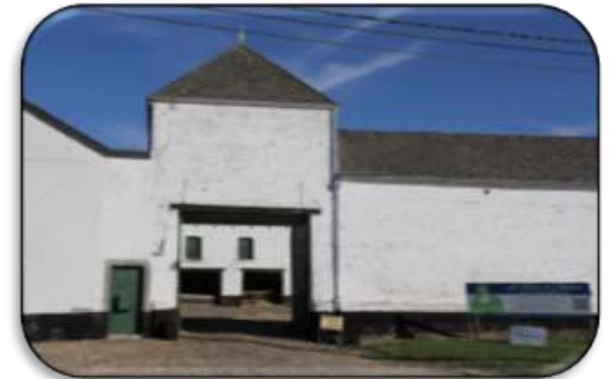
La Ferme du Château