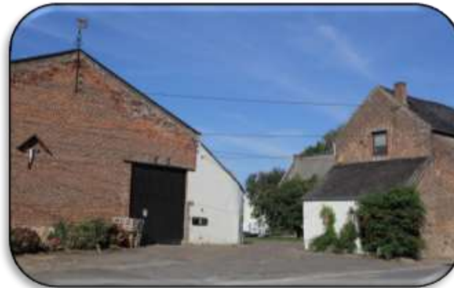
La Ferme Henricot

Prendre à droite dans la rue du Baty, entre la « Ferme Henricot » et la « Ferme du Château »